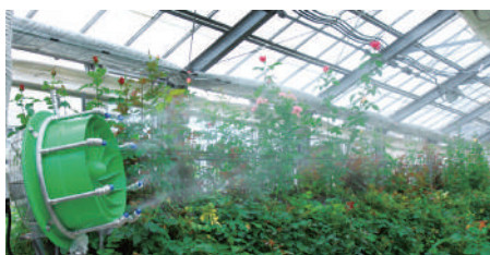
植物ハウス(熱暑・乾燥対策)