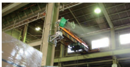
工場内(熱暑・粉塵対策)