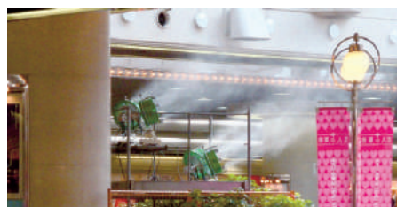
商業施設(熱暑対策)