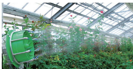
植物ハウス(熱暑・乾燥対策)