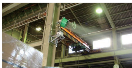
工場内(熱暑・粉塵対策)