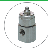
2流体ノズル CBIMVシリーズ