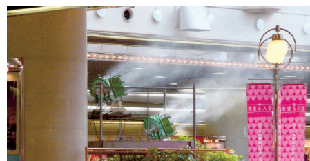
商業施設(熱暑対策)